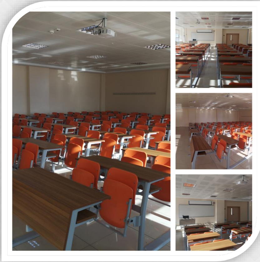
Tablo 1: Eğitim Alanları Derslikler (2024)