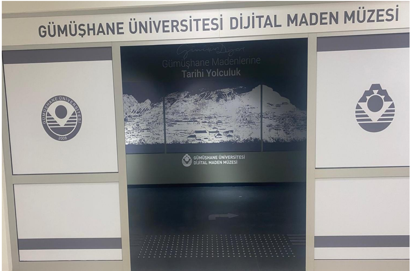
Gümüşhane Üniversitesi Dijital Maden Müzesi

2023K12-209436 'nolu İhtisaslaşma Projesi (DOKAP) Projesi kapsamında Makine ve Teçhizat alımı için, 2024 yılında İhtisaslaşma Projesi ödeneği olan 9.000.000 TL'den 9.000.000 TL harcanmıştır. Harcamanın toplam ödeneye göre gerçekleşme oranı, % 100 olarak gerçekleşmiştir.