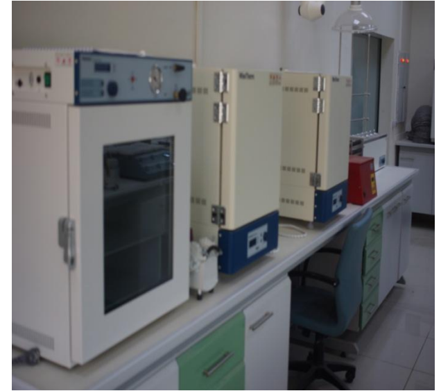
Resim 13 : Merkezi Araştırma Laboratuvarı İçerisinden Görüntüler