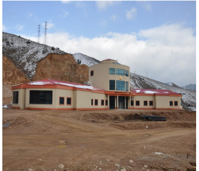
Resim 12 : Merkezi Araştırma Laboratuvarı