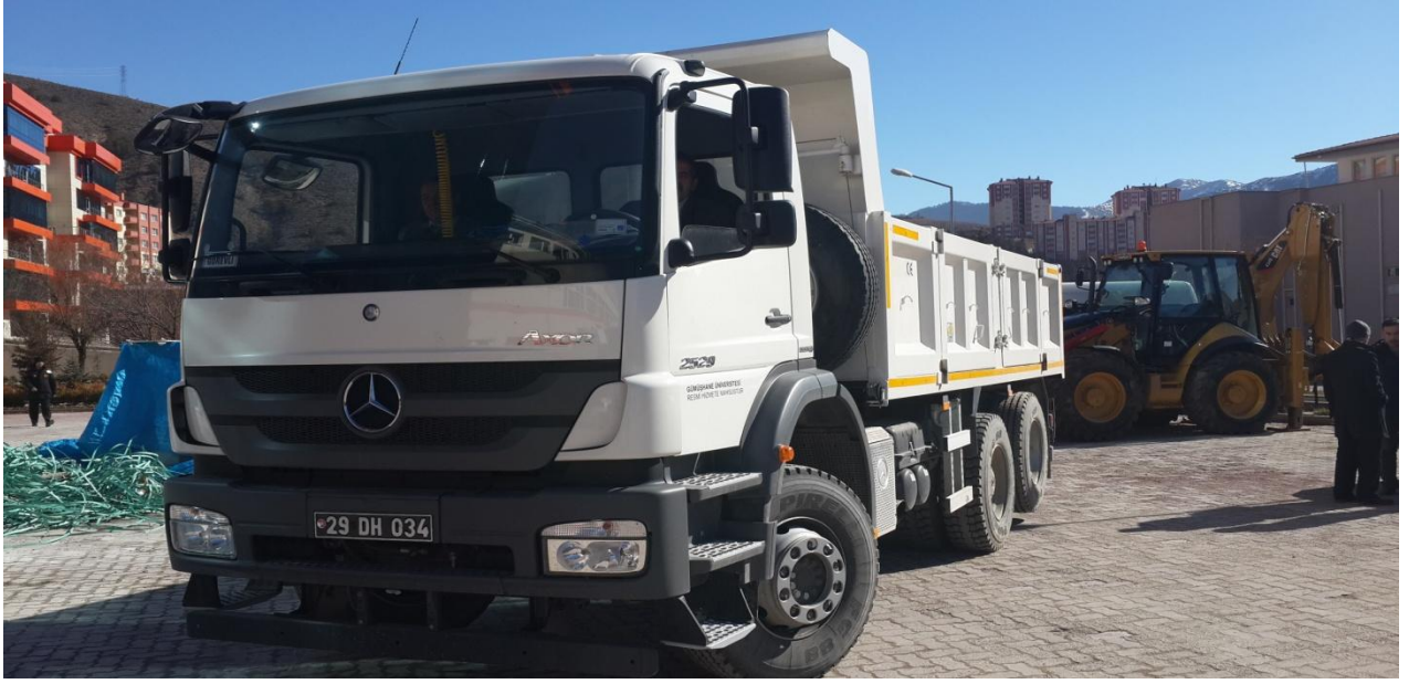
Resim 16 : Muhtelif İşler (DOKAP) Kapsamında Alınan Kamyon