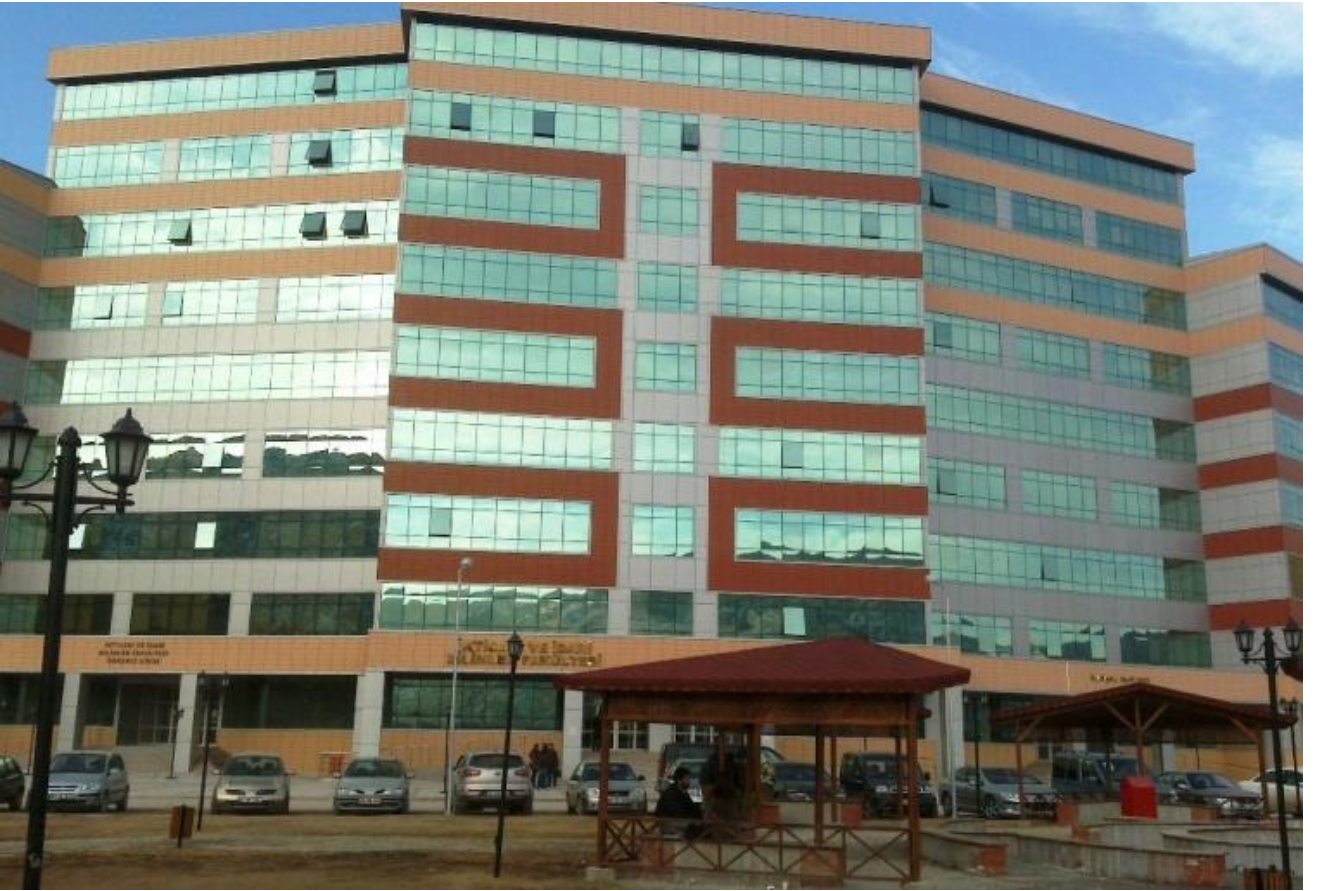
Resim 6 : İktisadi ve İdari Bilimler Fakültesi