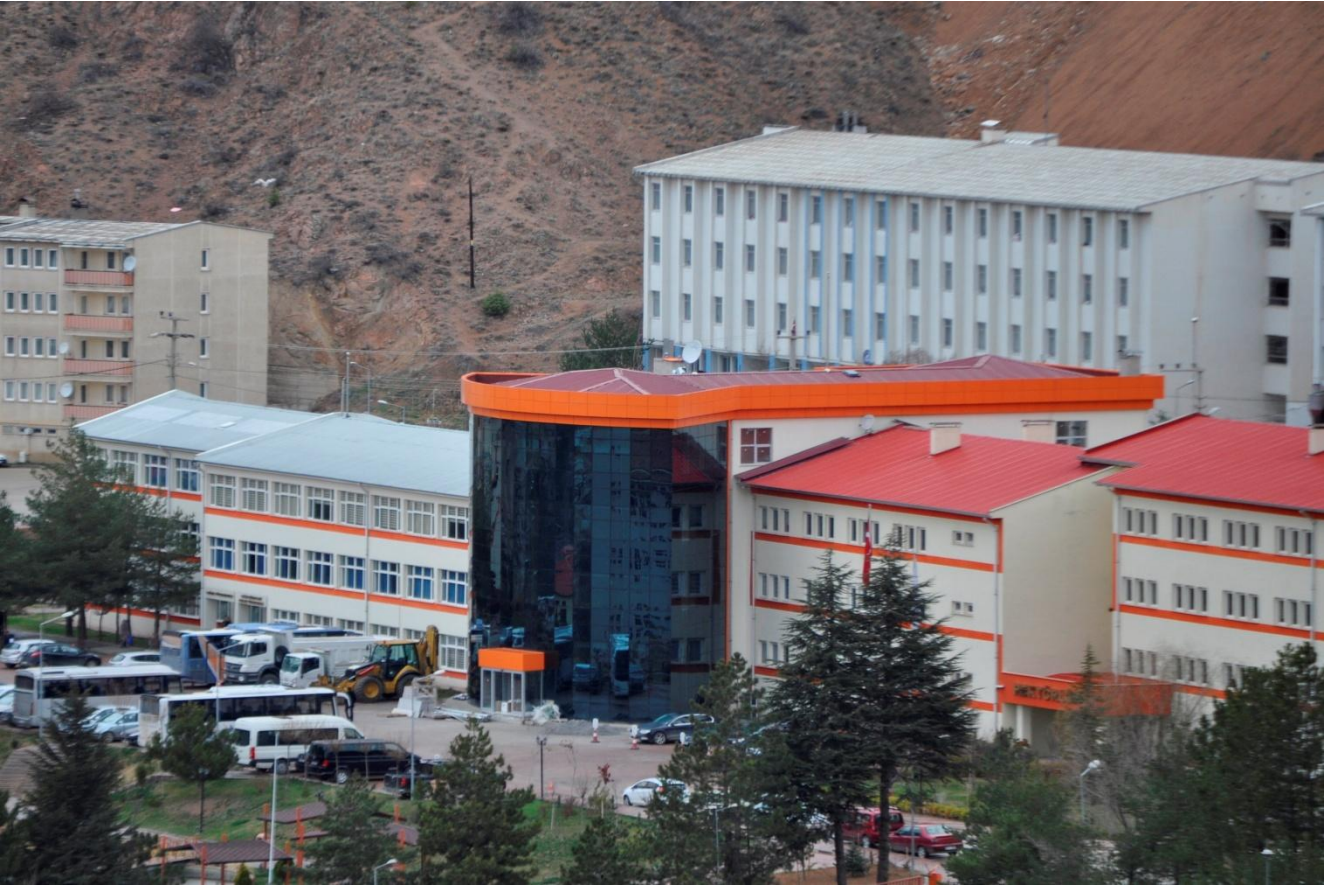
Resim 4 : Rektörlük Ek Binası