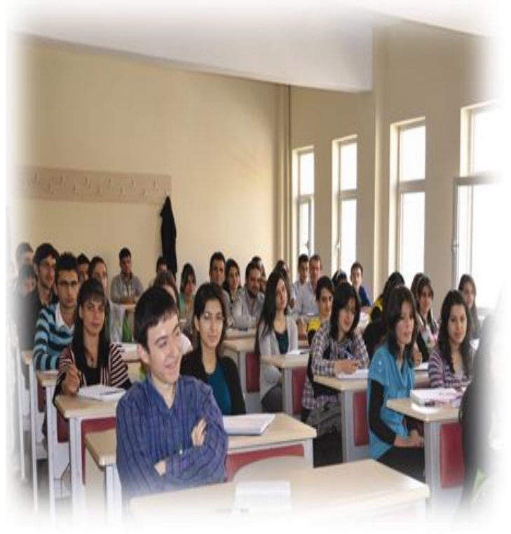
Resim 3 : Derslikler