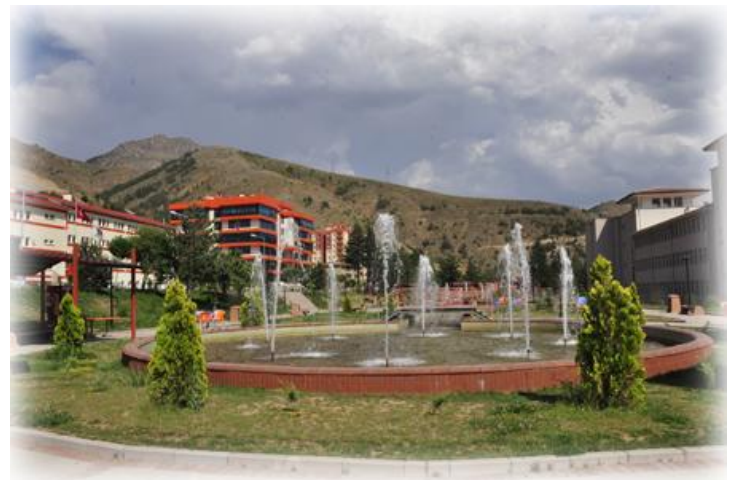
Resim 2 : Kampüs Altyapı Düzenlemesi