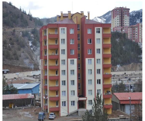
Resim 9 : 32 Dairelik Lojman