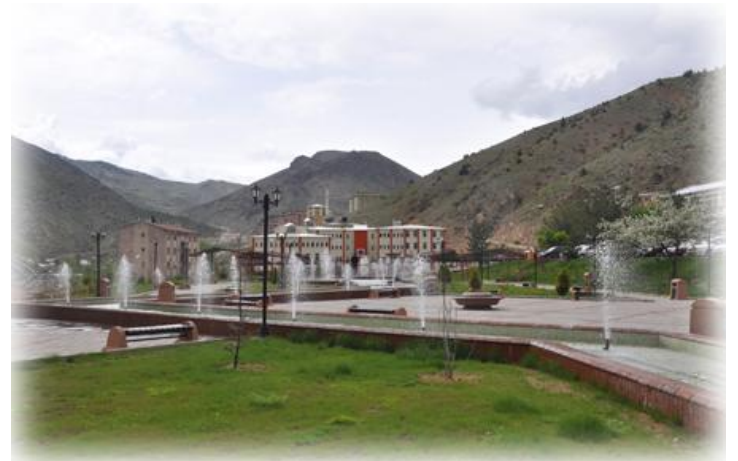
Resim 1 : Çevre Düzenlemesi