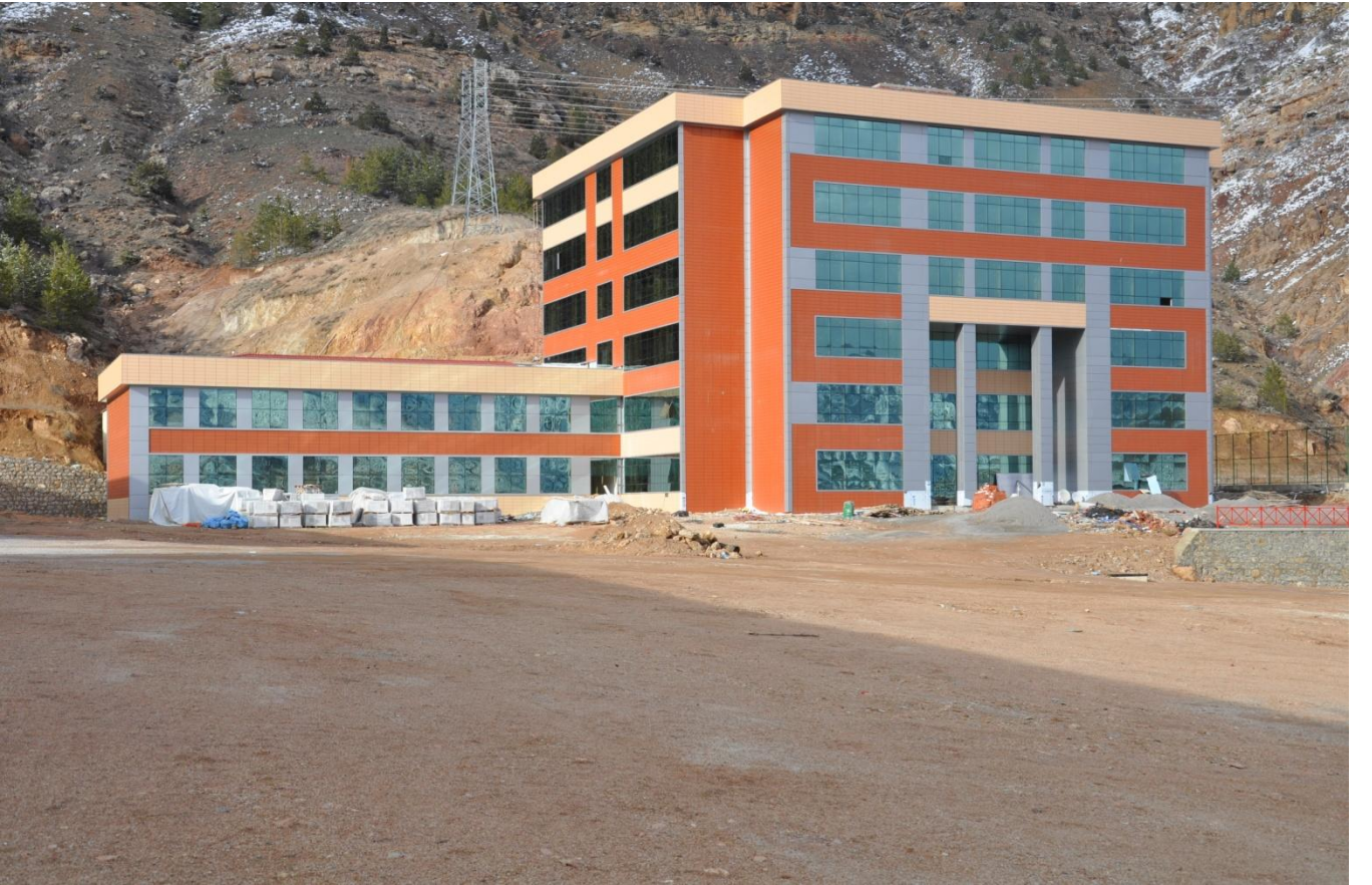
Resim 7 : Beden Eğitimi ve Spor Yüksekokulu