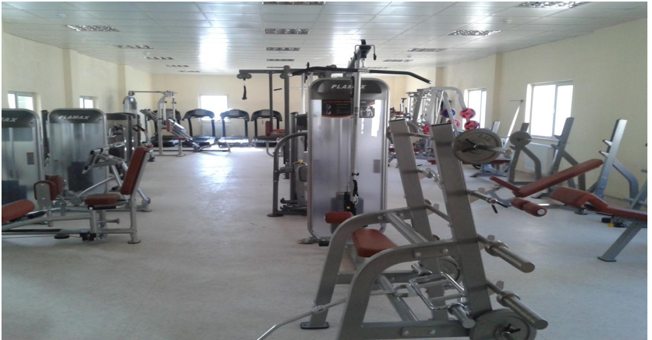
Resim 15 : Muhtelif İşler (DOKAP) Kapsamında Yapılan Sınıflar ve Alınan Malzemeler