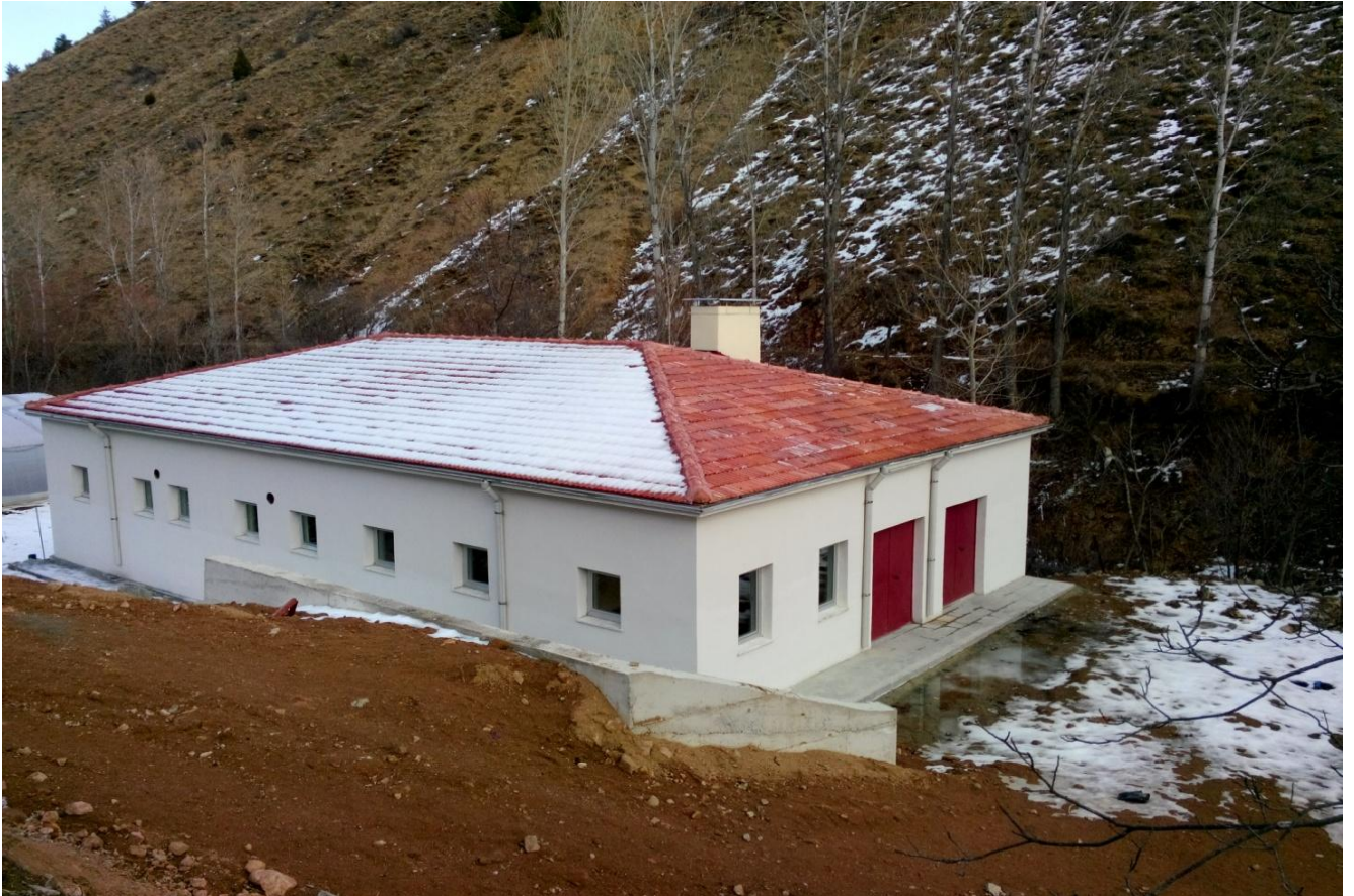
Resim 8 : Bildircin Ünitesi