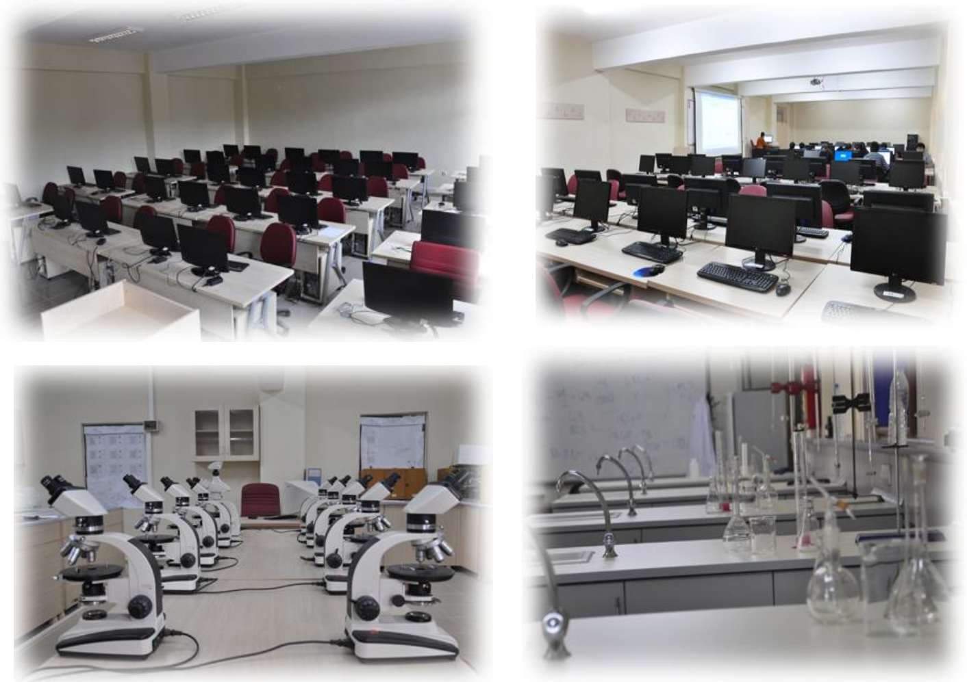
Resim 14 : Muhtelif İşler (DOKAP) Kapsamında Yapılan Sınıflar ve Alınan Malzemeler

Kalan 3.719.000,00 TL ödenek tutarından 2.910.000,00 TL harcama yapılmıştır. Harcamanın ödeneye göre gerçekleşme oranı % 78'dir.