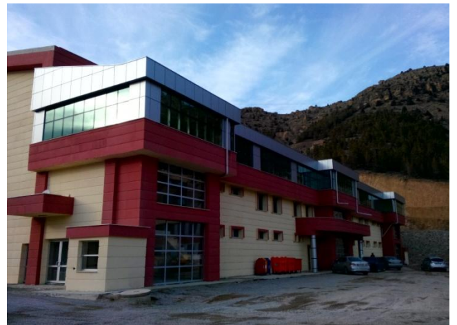
Resim 10 : Kapalı Spor Tesisi