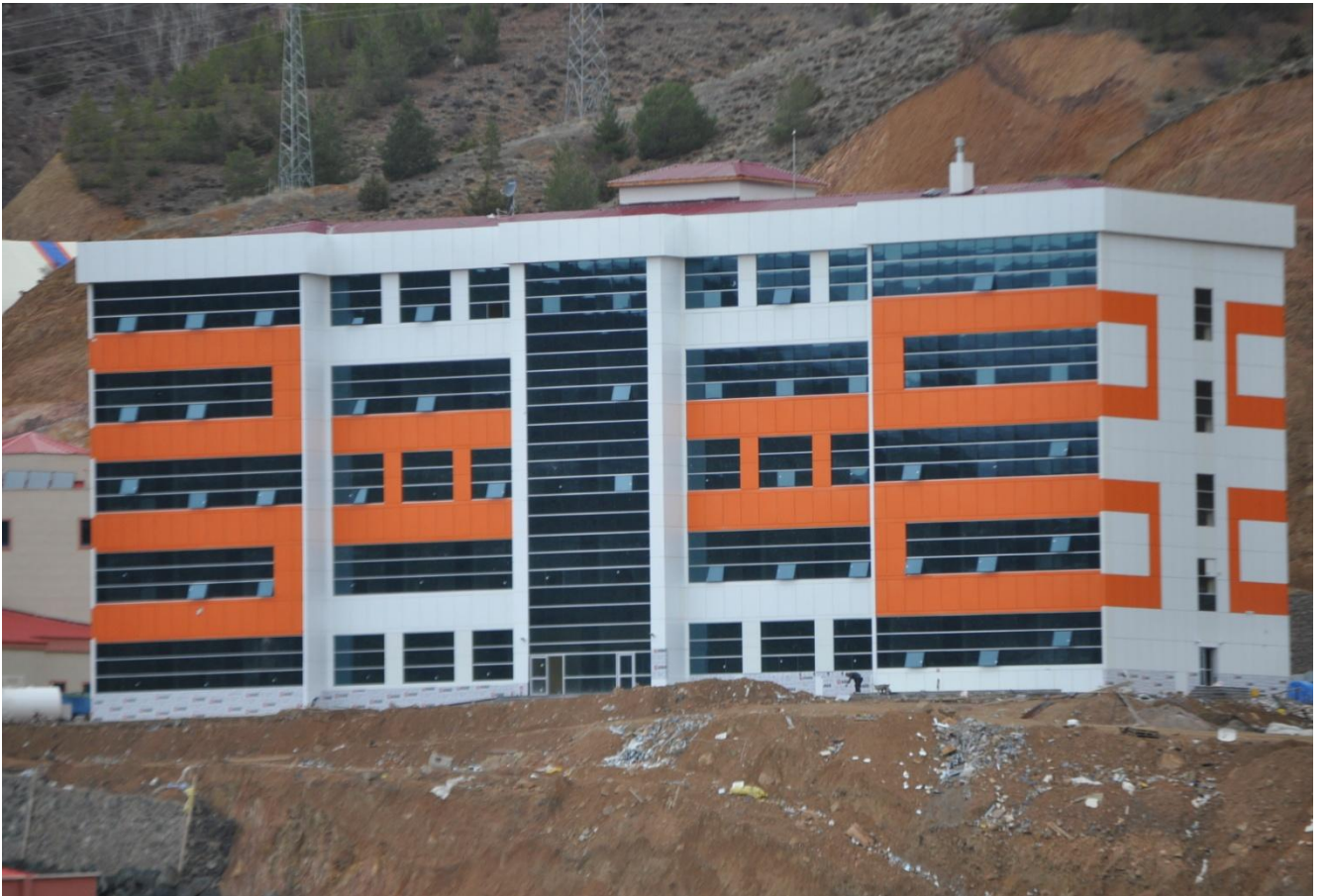
Resim 5 : Sağlık Yüksekokulu